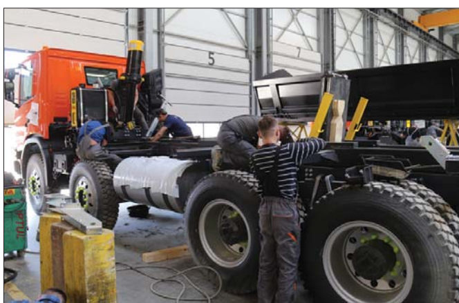
W nowej hali o powierzchni tysiąca metrów kwadratowych mieści się aż osiemnaście przestronnych stanowisk montażowych

Z pewnością dobrą receptą na przetrwanie trudniejszych czasów jest dywersyfikacja produkcji. KH-KIPPER zapowiada zwiększenie dostaw zabudów dla branży komunalnej. Firma angażuje się także w innowacyjne projekty ekologiczne. Odbiorcy z zachodniej Europy zamawiają na przykład zabudowy wyposażone w elektryczną przystawkę odbioru mocy. Mają być eksploatowane na terenach miejskich, gdzie ko-